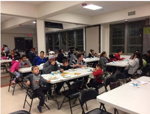
Medford PAC en octubre 2019