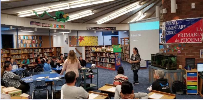
Phoenix/Talent PAC en octubre 2019