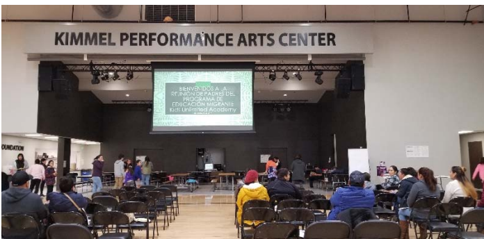
Kids Unlimited Academy PAC en diciembre 2019