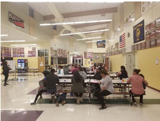
Eagle Point/White City PAC en noviembre 2019